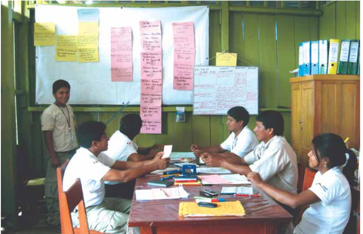
Guardaparques de la RCCHN estructurando su plan de patrullajes.