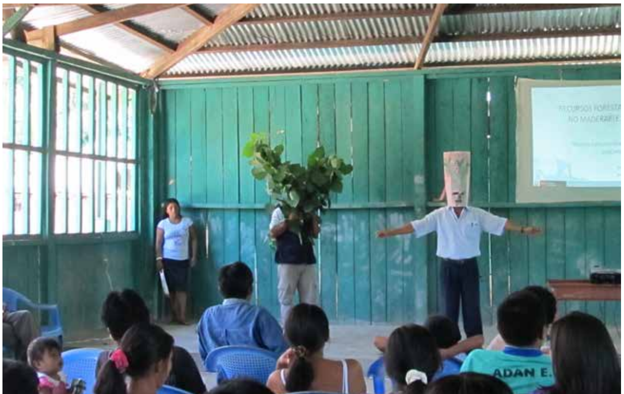
Sociodrama “El árbol vivo y el árbol talado” desarrollado en lengua awajún por los guardaparques de la Reserva Comunal Chayu Nain y promotores ambientales de APECO.

Con el apoyo del PDRS se logró diseñar colectivamente dos eventos educativos, cada uno con 3 sesiones educativas, los cuales fueron totalmente ejecutados por los guardaparques en la fase de socialización. Todo el material fue diseñado para ser desarrollado en awajún. El primero trató sobre cogestión, y desarrolló tres sesiones educativas: biodiversidad de la Reserva Comunal, cogestión y contrato de administración. El segundo evento tenía como eje el aprovechamiento de productos no maderables del bosque, y estuvo integrado también por tres sesiones educativas: mercado, bienes y servicios del bosque, y aprovechamiento de bienes del bosque en la Reserva Comunal. En todos los casos las sesiones educativas tenían como motivación un sociodrama, para el desarrollo del tema se diseñó un rotafolio y se construyó el aprendizaje con preguntas a la concurrencia y un mensaje final. Estas sesiones fueron socializadas en las comunidades por el equipo de guardaparques de la Reserva, en conjunto con el equipo de APECO.