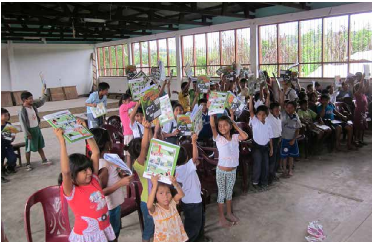
Alumnos de escuelas aledañas a ANP recibiendo los cuadernos escolares con temas alusivos a la RCCHN.