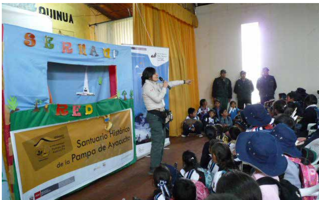
Sesión educativa usando títeres como medio de comunicación para transmitir conceptos de conservación y normas de uso en el SHPA.