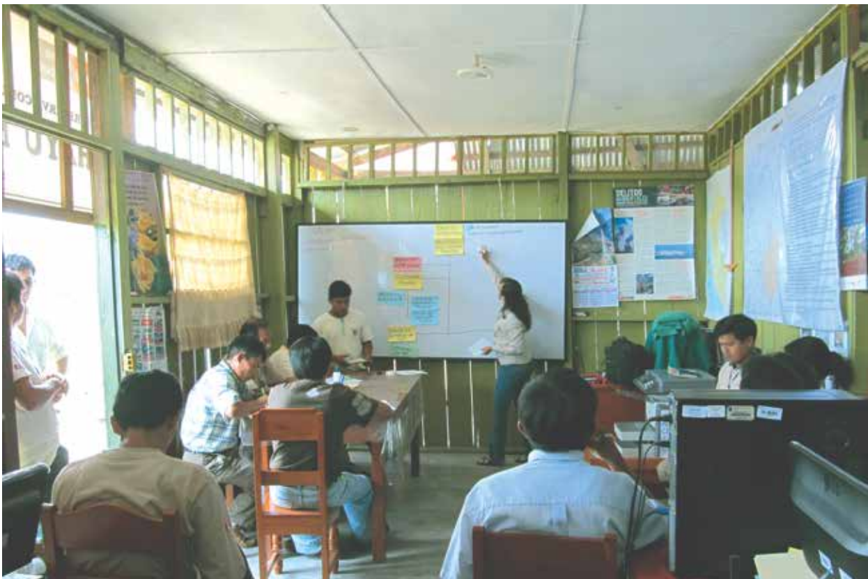
Capacitación a la ECACHAYUNAIN por los guardaparques de la Reserva Comunal.

Finalmente el establecimiento de una Zona Reservada en la Cordillera de Colán, que devino en su categorización, en 2009, como Reserva Comunal Chayu Nain, tuvo como propulsores a una organización regional indígena: el Consejo Aguaruna Huambisa, ocho comunidades nativas (a las que se añadirían tres más) y la ONG APECO. La Reserva Comunal ocupó sus primeros años de gestión en contribuir a organizar a las comunidades nativas y que éstas logren conformar una institución que los represente ante el SERNANP. No obstante, se había descuidado un tanto la incorporación de otros actores locales, a pesar que acudían a las convocatorias a distintos eventos relacionados con la gestión de la Reserva.