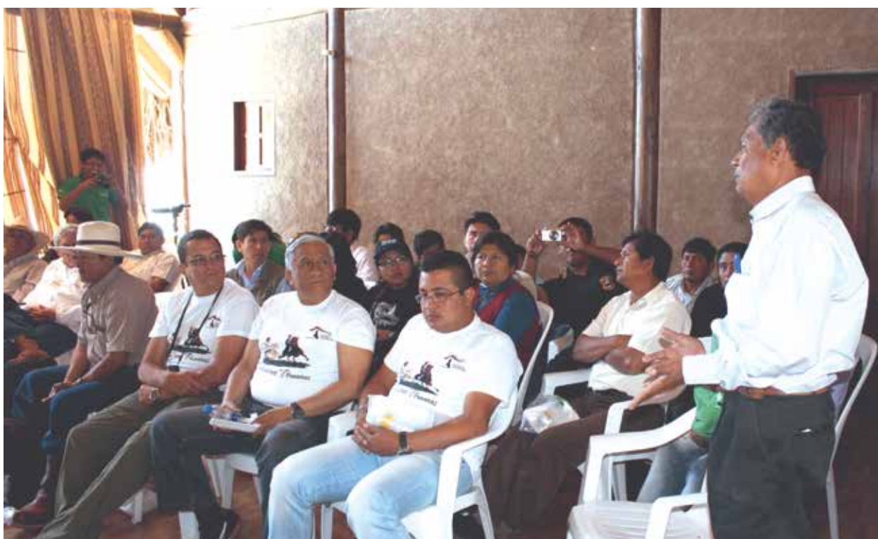
Comités de gestión: espacios de concertación para la gestión de las ANP.

En el caso de Illescas, un grupo de naturalistas locales autodenominado Grupo Illescas es el que ha venido empujando activamente su establecimiento como Zona Reservada en 2010 así como su proceso de categorización. En 2011 el proceso de categoriza-