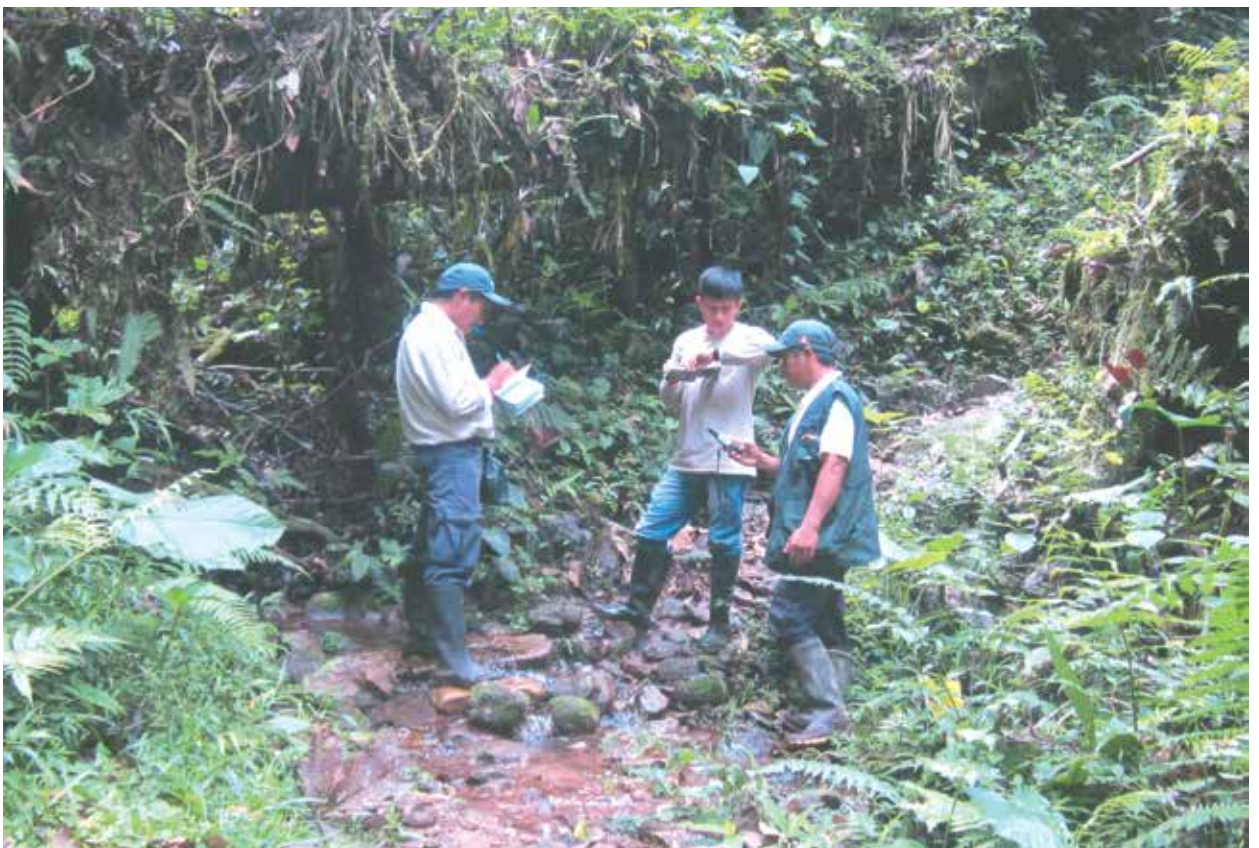
Brigada de guardaparques ejecutando un patrullaje planificado.