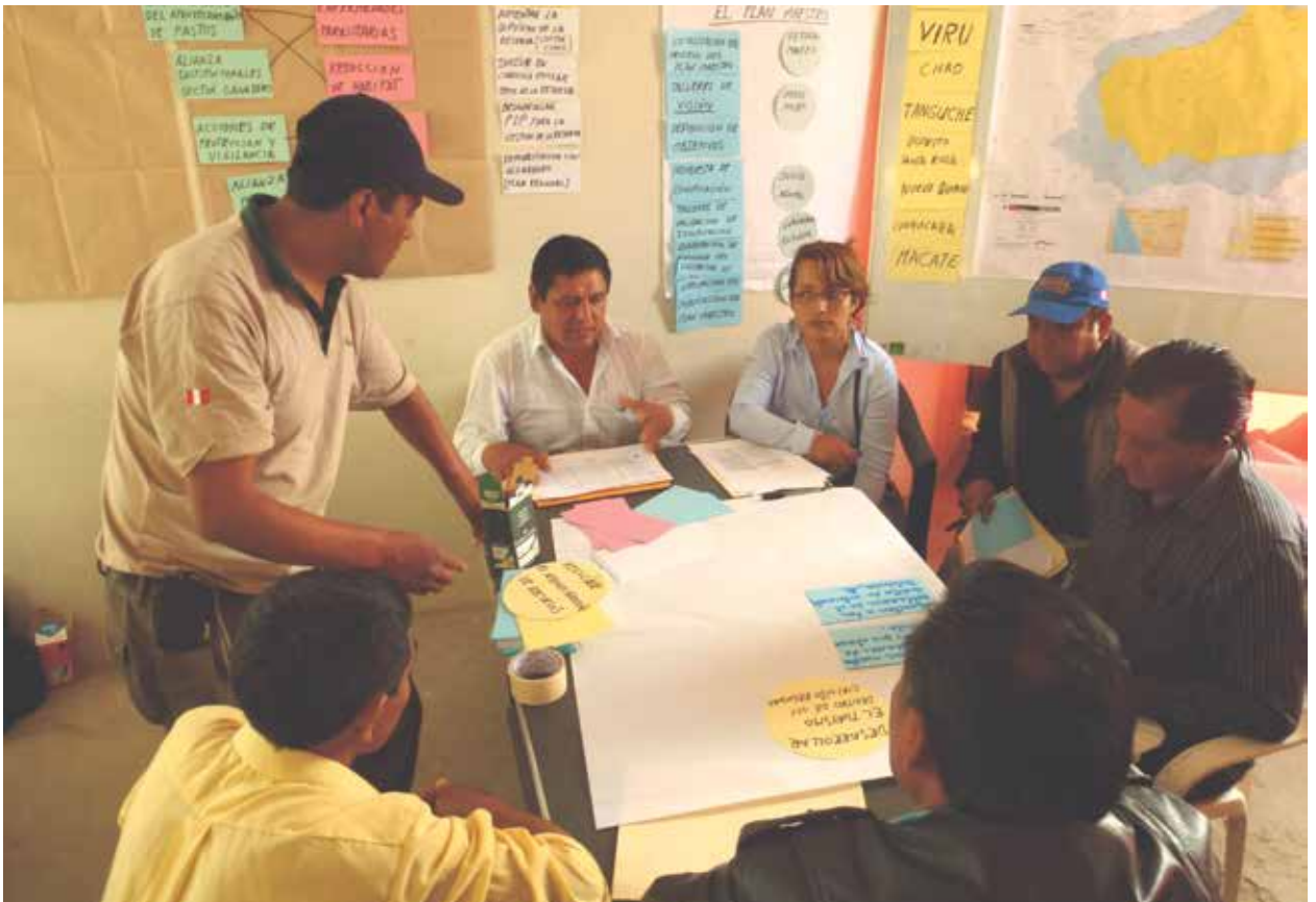
Guardaparque moderando grupo de trabajo en un taller para la elaboración de la visión de un Plan Maestro.