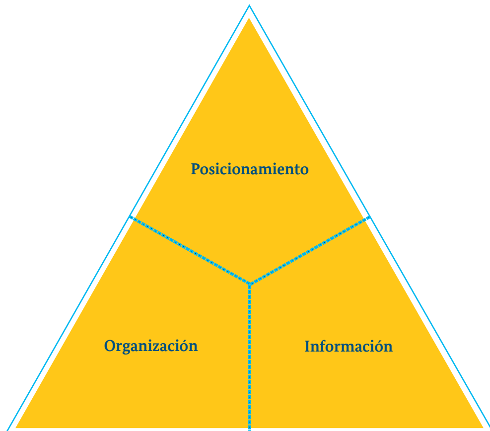
Figura 2: Los tres elementos temáticos clave para la gestión de un ANP: La pirámide de gestión debe contar con una base sólida de información pertinente y accesible; y una organización de roles y procesos. Sobre ella, debe haber un posicionamiento que proyecte la imagen deseada, comunicando los avances alcanzados y las acciones pendientes.

Posicionamiento: las acciones prospectivas (de generación de información) y la ejecución de las estrategias y planes de gestión de un ANP, deben ser acompañados con una buena “percepción” de terceros, respecto de los avances y retos de las acciones implementadas por la jefatura. Este posicionamiento que los demás tienen del ANP, se genera, tanto, por la imagen percibida, como por los mensajes transmitidos por el personal del área.