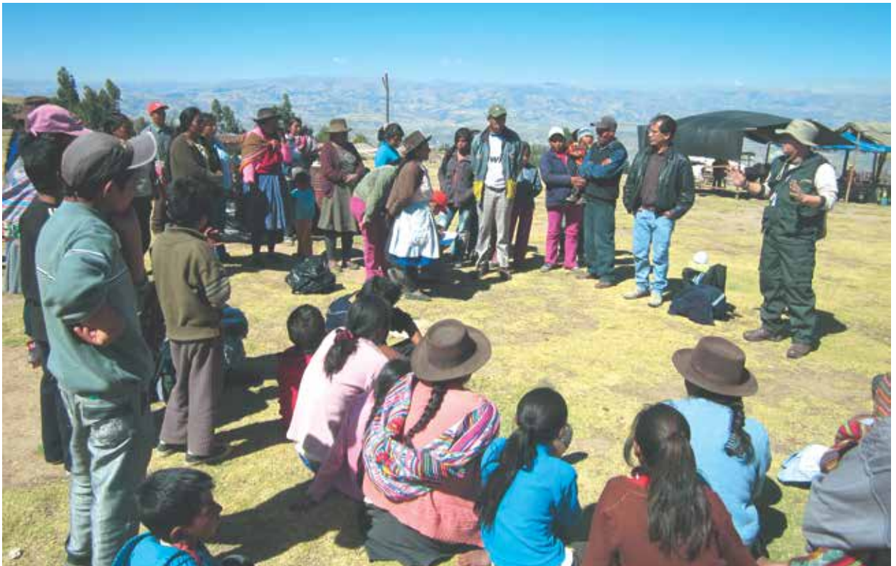
Personal del SERNANP dando charlas informativas a los artesanos, vendedoras de comida y paseadores a caballo del SHPA.

Como alternativa de gestión se propuso la firma de un convenio tripartito entre el Gobierno Regional de Ayacucho, la Municipalidad Distrital de Quinua y el SERNANP, esto con el fin de facilitar las acciones de cooperación entre las 3 instituciones orientadas a fortalecer la gestión del SHPA.